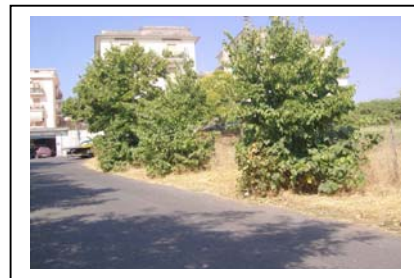
Setteville – Via Carducci