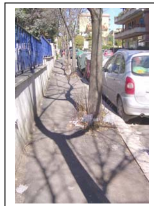
Setteville – Via Leopardi

OGNUNO E' LIBERO DI FARE I PROPRI COMMENTI ALLE FOTO SOPRA RIPORTATE PRECISANDO CHE QUESTE SONO “SOLO ALCUNE” DELLE “PICCOLISSIME” DIFFERENZE ESISTENTI.