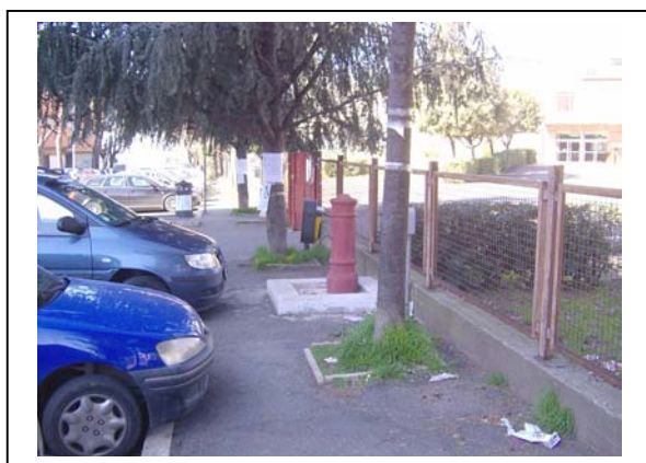
Foto n. 8 – Via Todini, da ingresso scuola elementare direzione Piazza Trilussa.

Proseguimento del marciapiede precedente, ma in questo caso il transito con eventuali carrozzine è impedito, oltre che dalle autovetture, dall’installazione della “ famosa fontanella ” che non è collegata alla rete fognaria, pertanto non funzionante e causa della rottura dell’asfalto appena rifatto. Lo stato di manutenzione è uguale al precedente tratto.