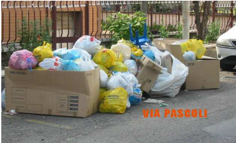
UNI DEI TANTI MUCCHI DI IMMONDIZIA A SETTEVILLE

In questi giorni si sta consumando l'ennesima dimostrazione di incapacità nel governare dei nostri amministratori circoscrizionali e comunali.