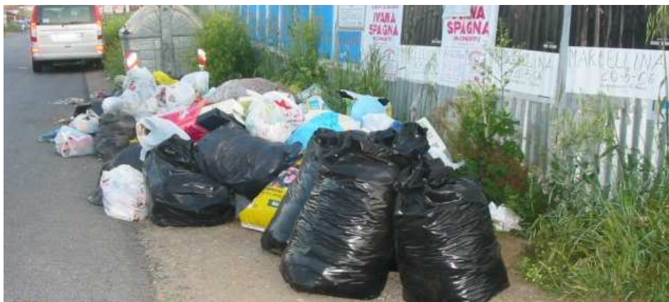
...anche Setteville Nord non se la passa certo bene!

Certamente un gesto simile è da biasimare, ma ne comprendiamo anche il perché: la cittadinanza è stanca di accettare tutto ciò che all'amministrazione passa per la mente!