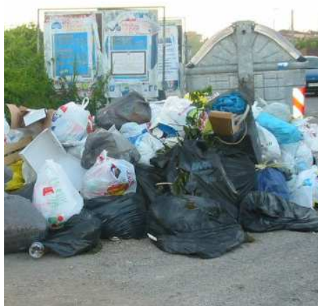
...ancora Setteville Nord...

Noi intanto con volantini, manifesti ed una lettera indirizzata al Sindaco, al Direttore del Dipartimento prevenzione ASL RM G, al Comando Carabinieri Nucleo Tutela Ambientale, abbia-