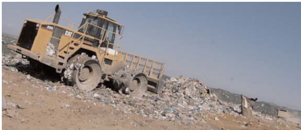
LA DISCARICA DELL'INVIOATA